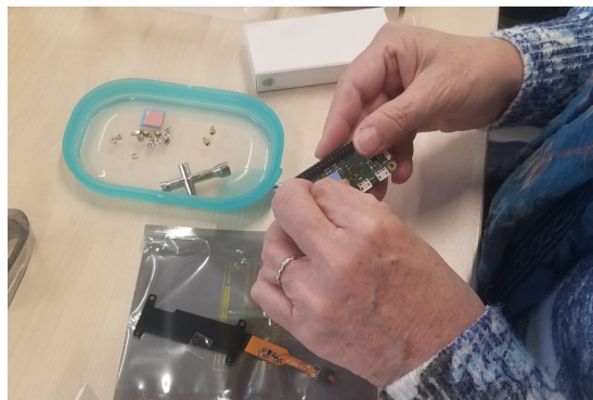
Création d'un piège photo

Nous avons utilisé un micro-ordinateur, un Raspberry Pi, pour créer ces pièges photo, en s'appuyant sur le code fourni dans le cadre du projet. Ayant déjà réalisé ce projet et créé un tutoriel de fabrication accessible sur le site d'Incaya, Thomas nous a apporté son soutien pour la mise en place et l'animation de cet atelier.