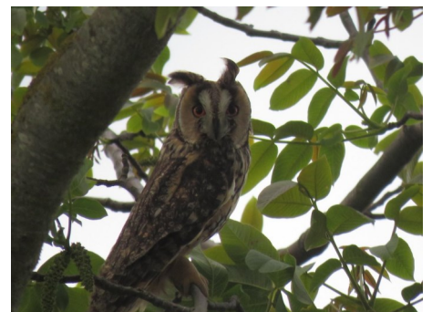
Hibou moyen-duc