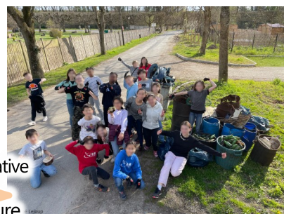
ATE avec le collège St Marie - Ramassage de déchets