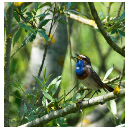
Gorgebleue à miroir