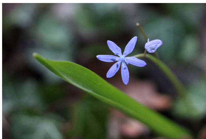
Scille à deux feuilles