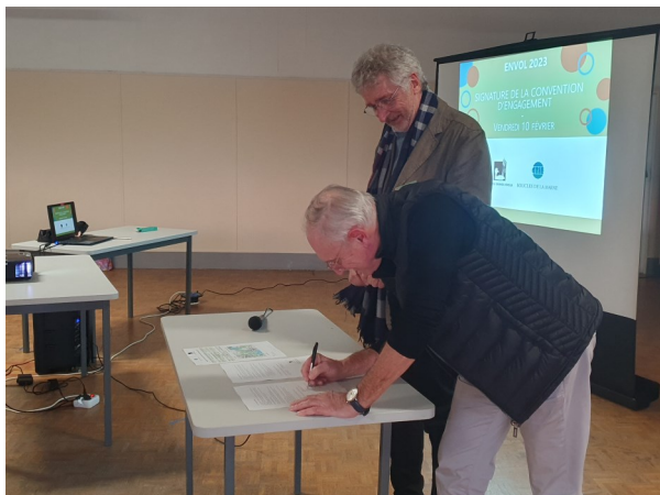
Signature de la convention CPIE