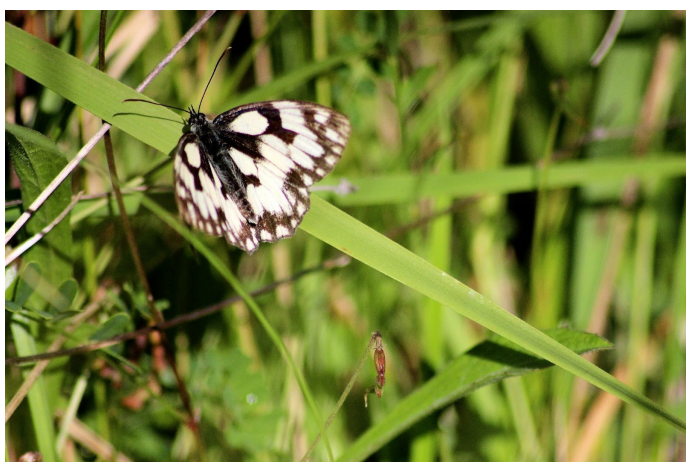
Demi-deuil © C. Giordano

* Zones naturelles d'intérêt écologique, faunistique et floristique