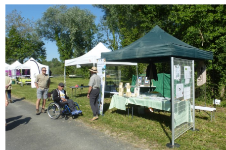
Fête de la pêche à Episy

Le président du CPIE des Boucles de la Marne, en très bon ambassadeur, s'en est donné à cœur joie auprès des élus locaux venus prendre un bol d'air. Il a ainsi eu l'occasion de faire la "réclame" pour les actions de notre association sur les terrains du Nord Seine-et-Marne, ainsi que sur la Réserve du Grand-Voyeux que beaucoup connaissent très bien !