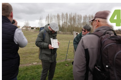
Sortie ornithologique