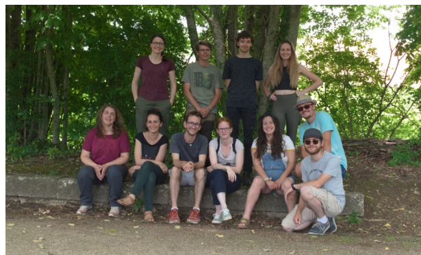
L'équipe salariée du CPIE des Boucles de la Marne