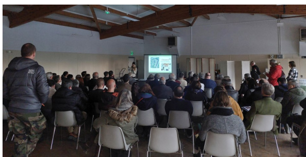
Des nombreuses personnes sont venues assister à la signature de la convention CPIE

* Centre Permanent d'Initiatives pour l'Environnement