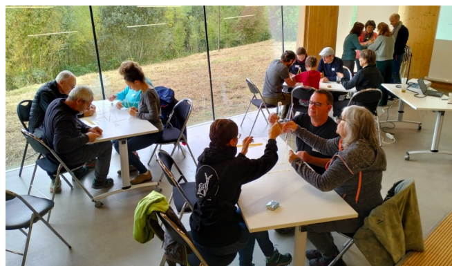
Construction de tours en spaghettis par équipes !