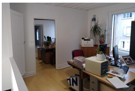
Nouveaux locaux

Ces nouveaux locaux mis à disposition par la Mairie de Trilport n'ayant pas été occupés depuis un certain temps, des travaux de rénovation ont été effectués par quelques bénévoles.