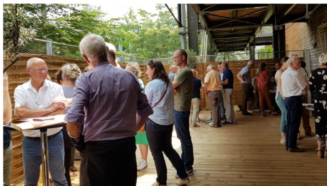
Congrès annuel des CPIE