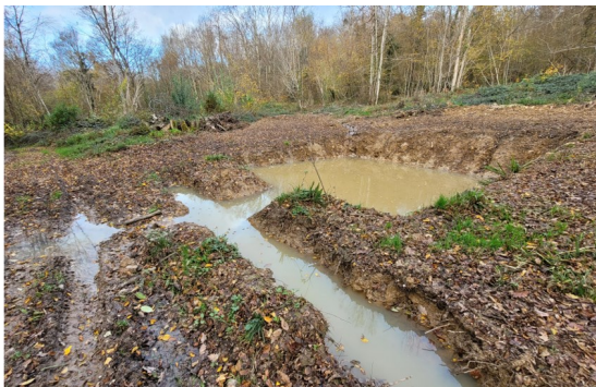
Création de mares et ornières en faveur du Sonneur à ventre jaune à l'automne 2023 à Orly-sur-Morin

Dans le cadre de ses missions, le CPIE des Boucles de la Marne a fait le choix en 2022 de s'engager dans la démarche Natura 2000 sur le site « Le Petit Morin de Verdelot à Saint-Cyr-sur-Morin ». Il assure dorénavant l'animation du site pour les milieux terrestres jusqu'en 2025. En 2023, les différentes actions réalisées ont consisté en la gestion administrative et financière (organisation de comité de pilotage, rencontres des services de l'État) ; la création et mise à jour d'outils de communication et média ; la sensibilisation du grand public et des scolaires (86 personnes sensibilisées), des élus, des propriétaires et usagers du site (près d'une centaine de personnes) ; la participation à des formations, rencontres et colloques ; l'apport de conseils dans le cadre de projets soumis à évaluation d'incidences Natura 2000 ; ainsi que la contractualisation avec des propriétaires/exploitants pour la gestion des milieux et de préservation des espèces (charte et contrats Natura 2000, travaux et adaptations de gestion).