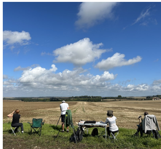
Bénévoles au comptage