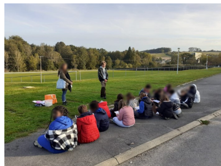
Animation scolaire

J'ai pris beaucoup de plaisir à concevoir cette animation mais surtout à la réaliser, d'entrer en contact avec un public, de présenter mes connaissances et de valoriser la biodiversité qui nous entoure.