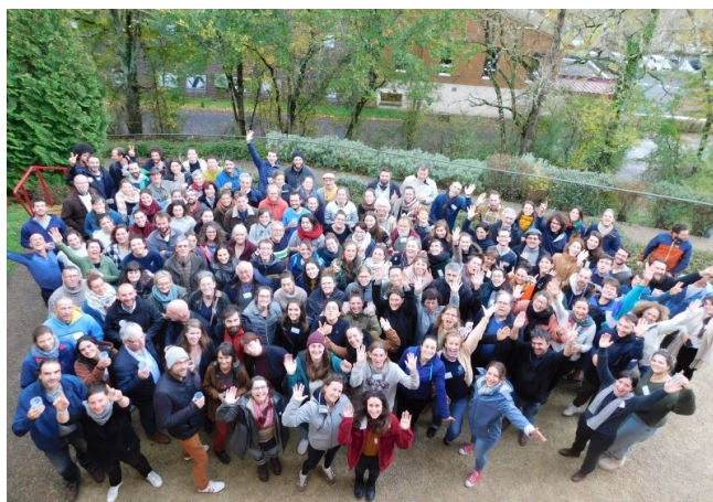
Rencontres nationales des CPIE