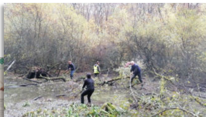
Prendre part à des missions de bénévolat