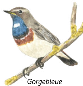
Gorgebleue à miroir

réalisé par Anne-Lise Koelher et Eric Serre Samedi 18 octobre | 14h - 15h