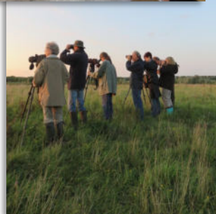
Avoir accès à des sorties privilégiées et à des ateliers