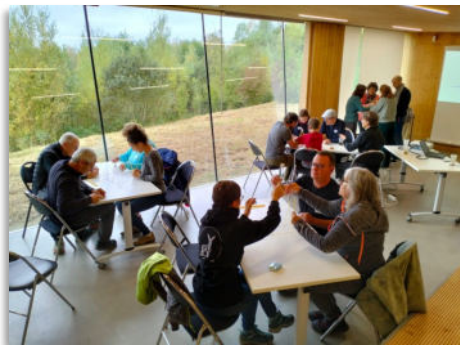
Participer à une vie associative riche et collaborative

Devenez adhérent-e ... Soutenez nos actions en faveur de l'environnement et rejoignez une communauté constituée de plusieurs centaines d'adhérent-e-s Adhérer, c'est également :