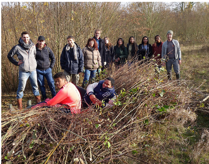
Chantier bénévole à Meaux - parc du Pâtis - le 27 novembre 2016

A Meaux nous continuons et renforçons nos activités au Parc naturel du Pâtis avec 3 visites grand public, des chantiers de bénévolat (merci à la mobilisation de nos adhérents !) et des événements comme le dixième anniversaire du parc. A la demande de certains établissements scolaires, nous y avons également développé des animations à leur intention. Nous en profitons pour vous inviter à découvrir sans plus attendre cet espace à la diversité écologique insoupçonnée.