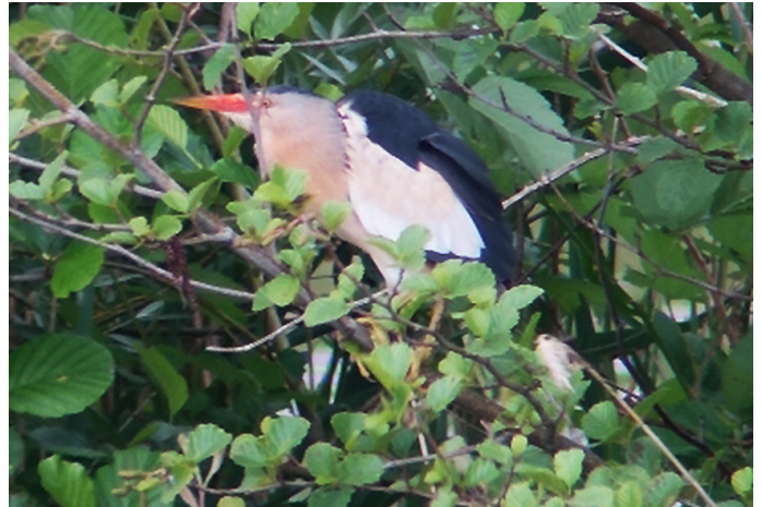
Texte et photo Romain Huchin

L'invité surprise de l'année ? : Le Grèbe à cou noir. C'est une première pour la Réserve et un cas rare au niveau régional. Un couple nicheur à proximité de la colonie de Mouettes rieuses et un poussin le 11 juillet, activement nourri par un adulte. Voilà un bel épilogue à la saison de nidification !