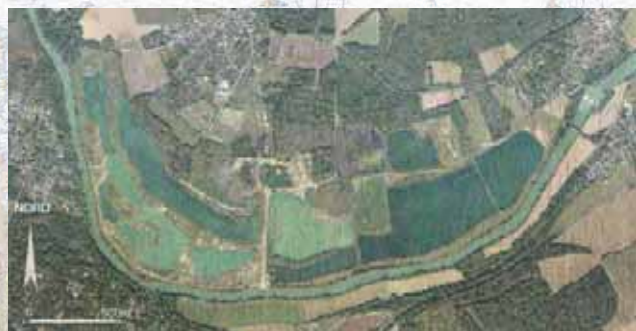
Vue aérienne du Grand-Voyeux - Été 2008

Ces espaces devraient, dans le courant de l'année 2011, devenir réserve naturelle régionale, passage obligé pour assurer pleinement la préservation de cette boucle de la Marne et engager ensuite les aménagements indispensables permettant à tout visiteur ou simple promeneur de profiter pleinement d'une nature particulièrement riche.